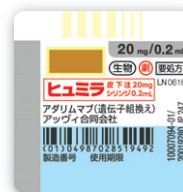
ヒュミラ® 皮下注 20mg シリンジ 0.2mL