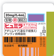
ヒュミラ® 皮下注 20mg シリンジ 0.4mL