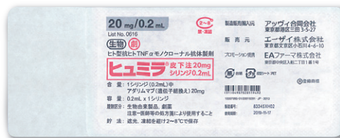
ヒュミラ® 皮下注 20mg シリンジ 0.2mL