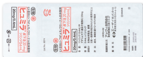
ヒュミラ® 皮下注 20mg シリンジ 0.4mL